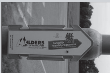
Nieuwe pijlen KNBLO