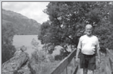
Door de Schotse Hooglanden