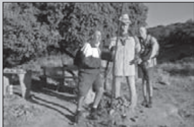
Op weg naar Compostela